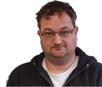
Mario Frederichs Water en riolering